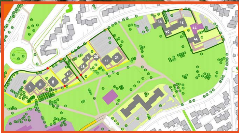
Vue de la résidentialisation du quartier de Rhin et Danube, Beaubreuil

Agence de proximité Nord-Est Limoges habitat